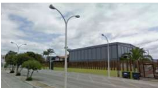
Figura 5: Cais dos Vapores

Consideramos este, um objecto multifuncional, pois integra funções de iluminação, de apoio, banco e balcão. Este teve como ideia principal o facto de existirem bastantes roulettes ao longo do percurso do plano de iluminação, e consideramos que estes tipos de espaço carecem de um ambiente mais próprio e funcional, estando também directamente associado a todo o tipo de comércio e centros geradores de actividades nocturnas.