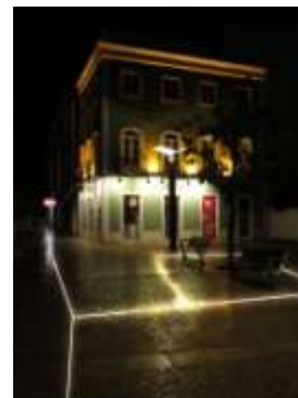
Figura 4: Simulação de linha de luz na Praça da República.

Consideramos este, um objecto multifuncional, pois integra funções de iluminação, de apoio, banco e balcão. Este teve como ideia principal o facto de existirem bastantes roulettes ao longo do percurso do plano de iluminação, e consideramos que estes tipos de espaço carecem de um ambiente mais próprio e funcional, estando também directamente associado a todo o tipo de comércio e centros geradores de actividades nocturnas.