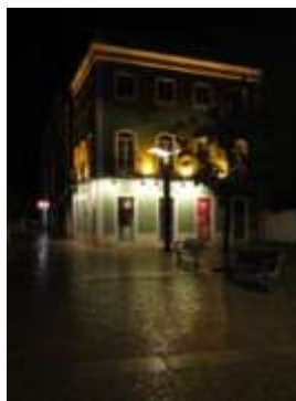
Figura 3: Praça da República

É sob forma de uma linha de luz branca que tem uma característica agregante de todo o espaço (desde o pavimento à fachada), que se vai projectando uma imagem contínua ao longo do percurso principal. Esta mesma linha de luz acarreta em si ainda uma função de indicação, na medida em que ao ligar estes pontos de interesse entre si, cria-se um percurso que do ponto de vista do utilizador pode ser determinante a nível de orientação e indicação de um mesmo percurso a ser tomado, no que diz respeito a lazer nocturno, encaminhando o utilizador no sentido destas mesmas actividades.