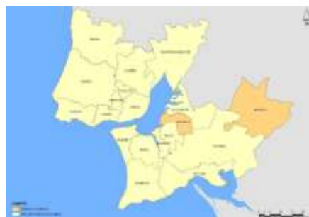
Figura 1: Enquadramento Territorial do Montijo na AML.

Situado na Margem Sul do Tejo, a cidade do Montijo pertence ao distrito de Setúbal, e integra-se na Área Metropolitana de Lisboa, bem como na região de Lisboa e Vale do Tejo (CCDR LVT), integrando-se neste modo na NUT II. A sua configuração administrativa apresenta-se sob contornos que são raros no panorama nacional, uma vez que é constituído por dois territórios