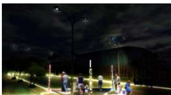
Figura 6: Simulação de ambiente geral do objecto e linha de luz branca no Cais dos Vapores