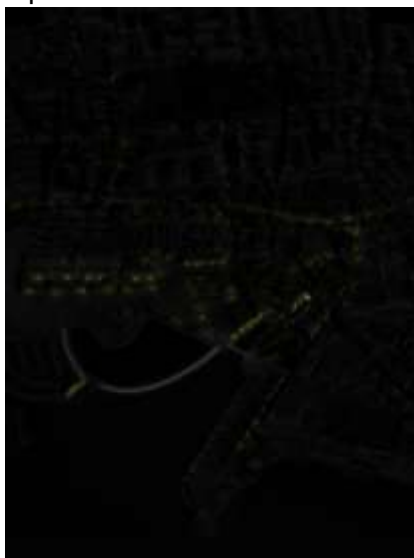
Figura 7: Estrutura de iluminação pública presente

A relação entre a linha de luz branca e o objecto físico, é essencial, pois as duas complementam-se, representando a linha branca o percurso, e o objecto como ponto de paragem, assumindo-se como o complemento do percurso de luz.