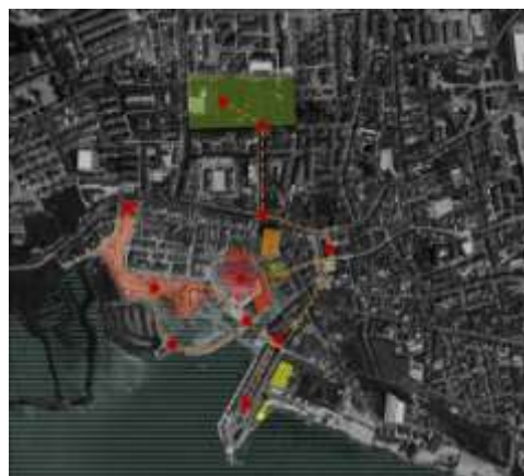
Figura 2: Análise do Caso de Estudo

No percurso principal foi verificado um considerável fluxo de pessoas, consequência da existência dos vários pontos de lazer nocturno, como bares, discotecas e mesmo jardins urbanos. Foram também identificados locais de interesse, cuja requalificação seria um incremento de valor à cidade durante o período nocturno. É bastante perceptível um tratamento