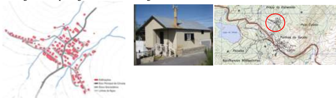
Fig. 3 – Bairro Penha Sol – Encosta Sul da Serra da Estrela.

Caracteriza-se por infra-estruturas precárias, acessos viários de perfis acanhados, ausência de lugares de estacionamento adequados, passeios ou zonas verdes com iluminação pública, abastecimento de água ou rede de saneamento deficitários. Os edifícios foram implantados sem qualquer critério, utilizando materiais de construção inadequados como chapas de zinco que lhe atribuem uma imagem urbana descaracterizada e desqualificada, pouco digna de um espaço natural, legando na paisagem uma marca negativa.