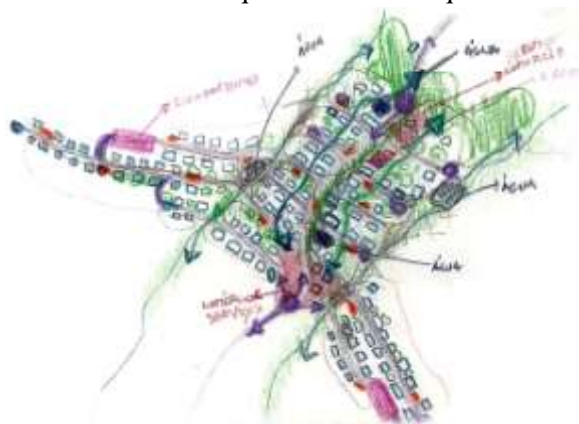
Fig. 4 – Proposta de desenho urbano para o bairro da Penha Sol – análise.

Propostas como a que seguidamente se apresenta são apenas um caminho para redesenhar este bairro, numa solução urbanística ecologicamente sustentável. Propõe-se o aproveitamento das águas pluviais, armazenadas para a rega das zonas verdes, a utilização de painéis fotovoltaicos e energia geotérmica para a produção de energia, com vista a contribuir para o abastecimento da energia eléctrica, entre outras soluções, a nível construtivo ou estético de volumetria e alinhamento dos imóveis, devolvendo a identidade de um aglomerado de montanha. As duas linhas de água que atravessam o bairro foram elementos urbanos definidores da proposta. A conceção de espaços públicos, equipamentos ou do pequeno comércio visam criar micro centralidades favoráveis quer a residentes quer a utentes esporádicos.