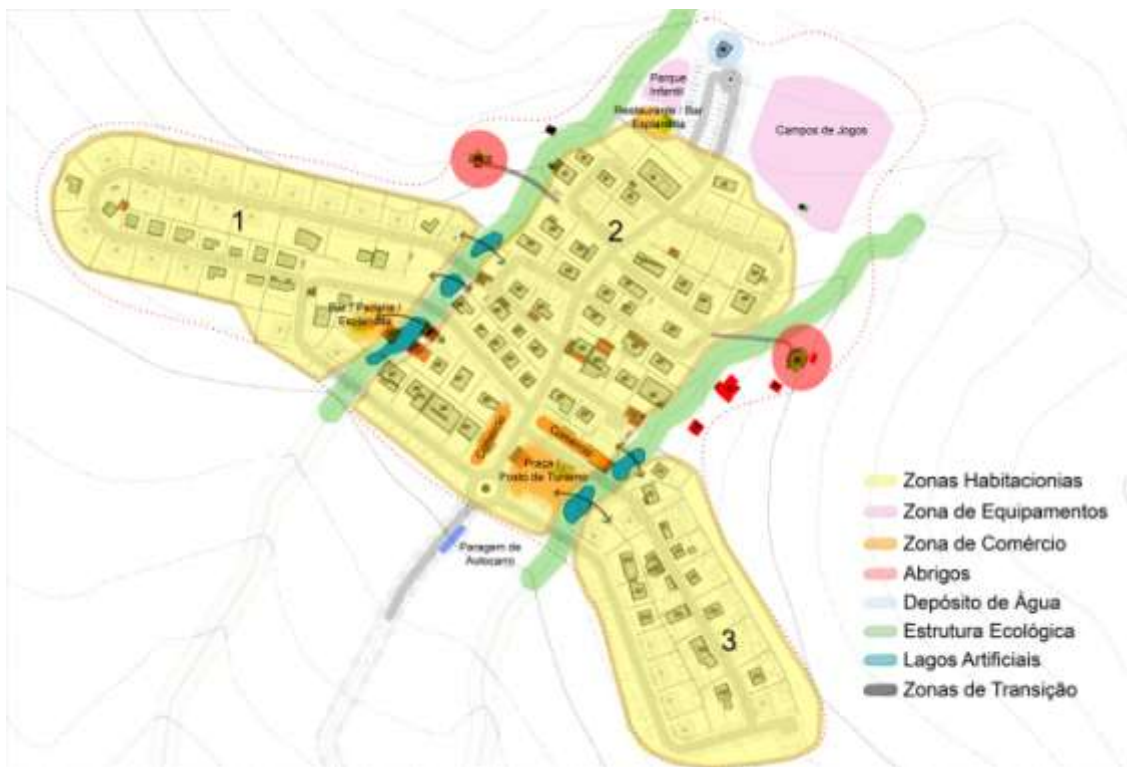
Fig. 5 – Proposta de desenho urbano para o bairro da Penha Sol – plantas síntese. (Fonte: Daniel Trindade, Dissertação de Mestrado Integrado em Arquitectura, DECA-UBI, 2010 ).