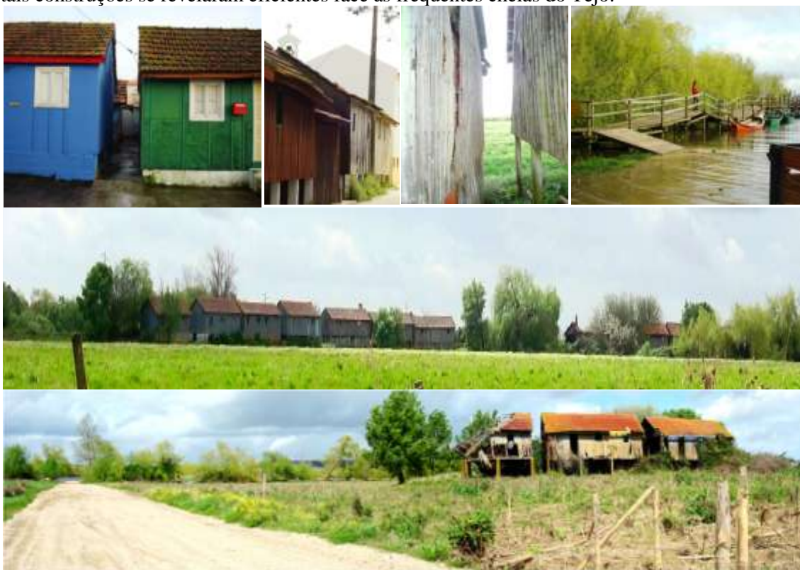
Fig.1 - Aldeias Avieiras junto ao Tejo.

A palafita sobre a água é uma das mais antigas tipologias da arquitectura vernácula, cuja origem e permanência pode ser entendida através de uma viagem no tempo e à volta do mundo. As aldeias Avieiras do Tejo expressam a diversidade ecológica do rio e cultural da malha urbana e são o testemunho de uma longa história de geografias comuns entre o rio e o urbano. Constituem a única herança palafítica fluvial da arquitetura vernácula na Europa, que adaptou a arquitetura da costa Atlântica; a eficaz palafita face às movediças dunas de areia; ao rio onde tais construções se revelaram eficientes face às frequentes cheias do Tejo.